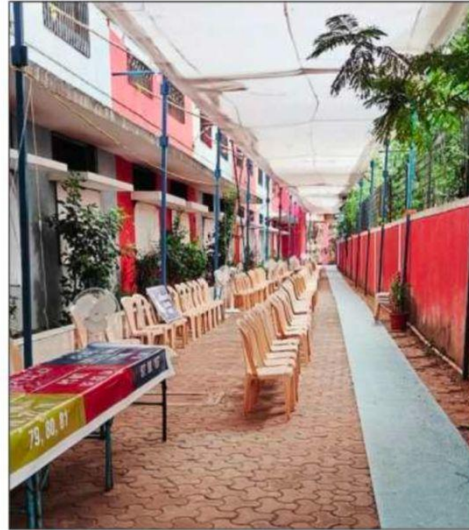
Addressing complaints of long queues during Lok Sabha polls, seating arrangements have been made at some polling booths this time. This photo shows a Worli municipal school, which serves as a poll station

bai," said an official involved in the process.