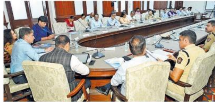
Officials from various agencies were present at the meeting; (inset) BMC Commissioner Bhushan Gagrani addressing the meeting

Gagrani further emphasised the need for joint teams from the relevant agencies to be deployed at checkpoints across Mumbai