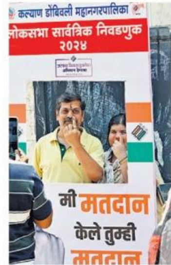
Voter turnout in Mumbai has remained consistently low over the years.

Additional DEO Joshi instructed that the initiatives