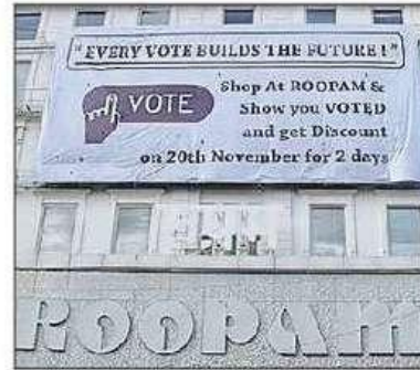
Roopam store near CSMT is offering a discount.