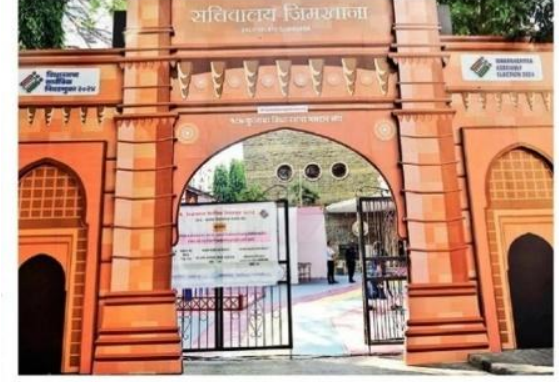
कुलाबा मतदारसंघात मतदान केंद्रावरील सचिवालय जिनजाबाच्या प्रतिकृती उभारण्यात आली आहे.

मतदान केंद्रे आकर्षक करण्यासाठी वेगवेगळ्या संकल्पना राबवण्यात आल्या आहेत. मतदारसंघाचे वैशिष्ट्य लक्षात घेऊन प्रतिकृतीचा वापर करण्यात आला आहे. केंद्राच्या आतील भागात रंगीतरींगी आच्छादने लावण्यात आली आहेत. टेबलांवरही छान कापड अंथरण्यात आले आहे. वेसावेतील एक केंद्र या भागाचे वैशिष्ट्य अधोरेखित करते. वेसावे, यारी रोड येथील महापालिकेच्या उच्च माध्यमिक शाळेत खास येथील मतदान केंद्रात कोळीवाड्यातील घरे, त्यांच्या मासेमारी बोटी आणि मासेमारी व्यवसाय, मासेमारीला लागणारी साधने, कोळी समाजाचे आदरतिथ्य आणि त्यांची संस्कृती यांचे दर्शन घडविणारा देखावा साकारला आहे.