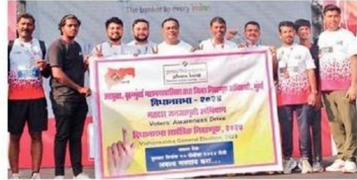
आयआयटी मुंबई अर्ध मॅरेथॉनवेळी मतदानाबाबत जागृती करण्यात आली.