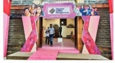
लोकमत निवडणुकीत कमी मतदान झालेल्या विधानसभा मतदारसंघांमध्ये कुलाबाच्या समावेश होत. त्यामुळे मतदान प्रतियोगी अधिक सुलभ करण्याच्या दृष्टीने निवडणूक आयोगातर्फे मतदारांसाठी विविध सुविधा उपलब्ध करून दिल्या आहेत. मतदान केंद्रावर मतदारांसाठी आणि येथील उपस्थित कर्मचाऱ्यांसाठी सर्व सुविधा उपलब्ध करून देण्यात आल्या आहेत. या मतदारसंघातील काही मतदान केंद्रे ही मुंबईची ओळख असणाऱ्या गोष्टींनी सजून घेऊन सजवण्यात आले आहे. मतदानाचा आकडा वाढवा, म्हणून प्रयत्न करण्यात येत आहे.

लोकमत न्यूज नेटवर्क मुंबई : कुलाबा मतदारसंघात निवडणुकीत मतदानाचे प्रमाण कमी असे. त्यामुळे हे प्रमाण वाढवणे, यासाठी विशेष मोहीम हाती घेण्यात आली आहे. येथे २०१९ विधानसभा निवडणुकीतही ४० टक्के मतदान झाले होते. त्यामुळे यंदाच्या निवडणुकीत मतदानाचा टक्का वाढविण्यासाठी आयोग विशेष प्रयत्न करीत आहे. त्यानुसार यावेळी विधानसभा निवडणुकीत मुंबईची ओळख असणाऱ्या गोष्टींनी मतदान केंद्रे सजली आहेत.