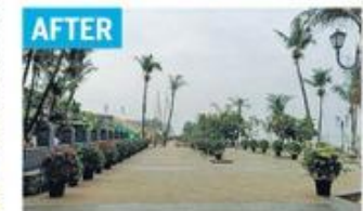
The before and after pictures that locals attached with their letter