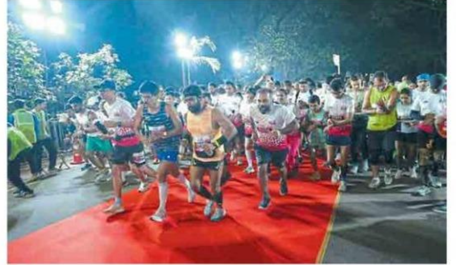
मुंबई : पवई येथे पार पडलेल्या हाफ मॅरथॉन स्पर्धेमध्ये सहभागी झालेले स्पर्धक.

मॅरथॉन स्पर्धेमध्ये मतदान जनजागृतीसह मुंबई महानगर स्वच्छ, सुंदर कसे ठेवण्याबाबतही जनजागृती करण्यात आली. मुंबईचा सभोवताल अधिकाधिक हरित ठेवण्यासाठी वृक्ष लागवडीवर भर देण्यासंदर्भातही धावपटू आणि मुंबईकरांना माहिती देण्यात आली.