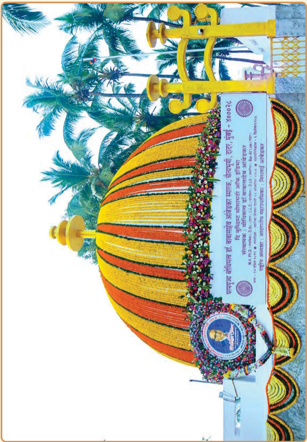
भारतरत्न डॉ. बाबासाहेब आंबेडकर यांचे स्मृतिस्थळ, चैत्यभूमी, दादर