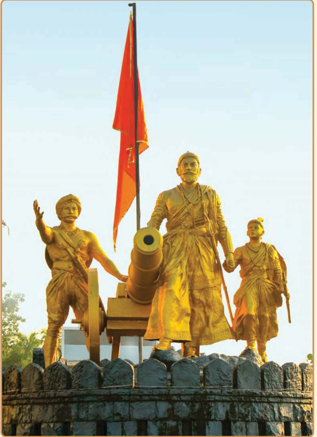
छत्रपती शिवाजी महाराज आणि संभाजी महाराज यांचा जुहू चौपाटी येथील पुतळा.