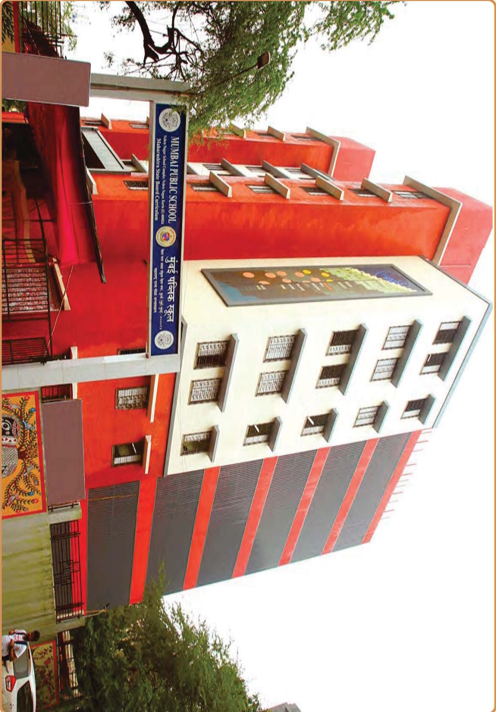
मुंबई पब्लिक स्कूल, नेहरू नगर, कुर्ला