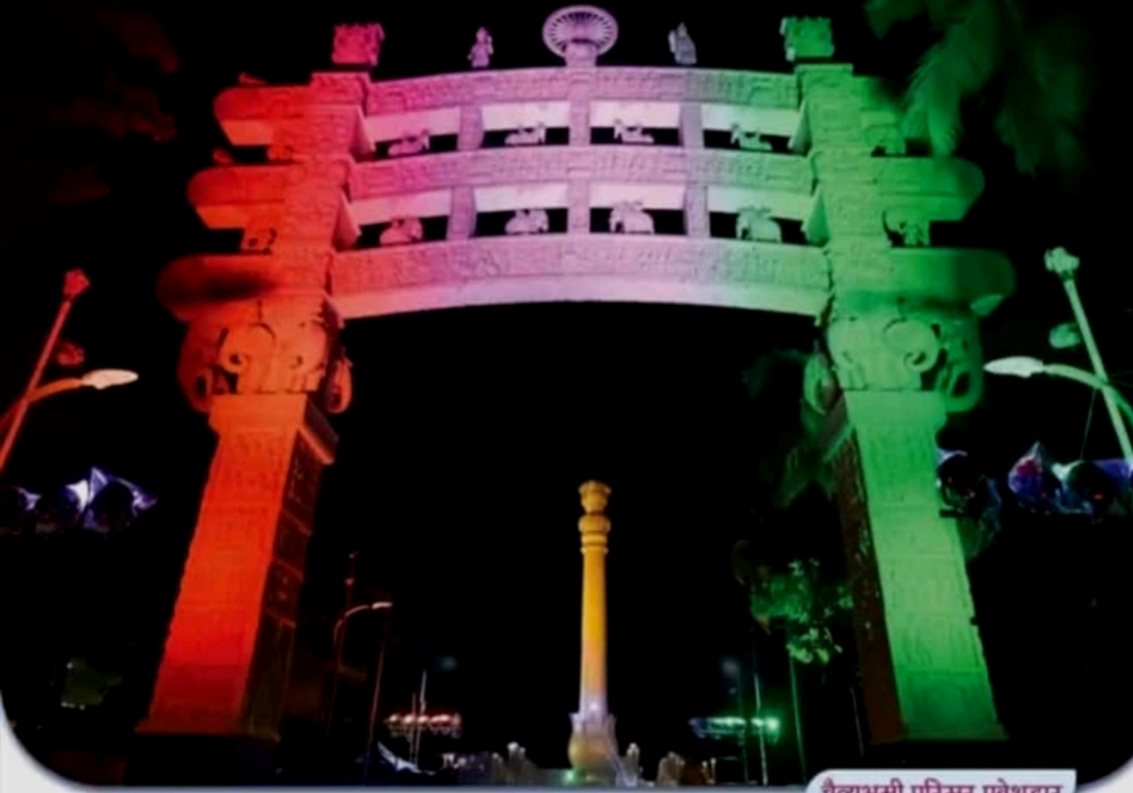
चैत्यभूमी परिसर प्रवेशद्वार