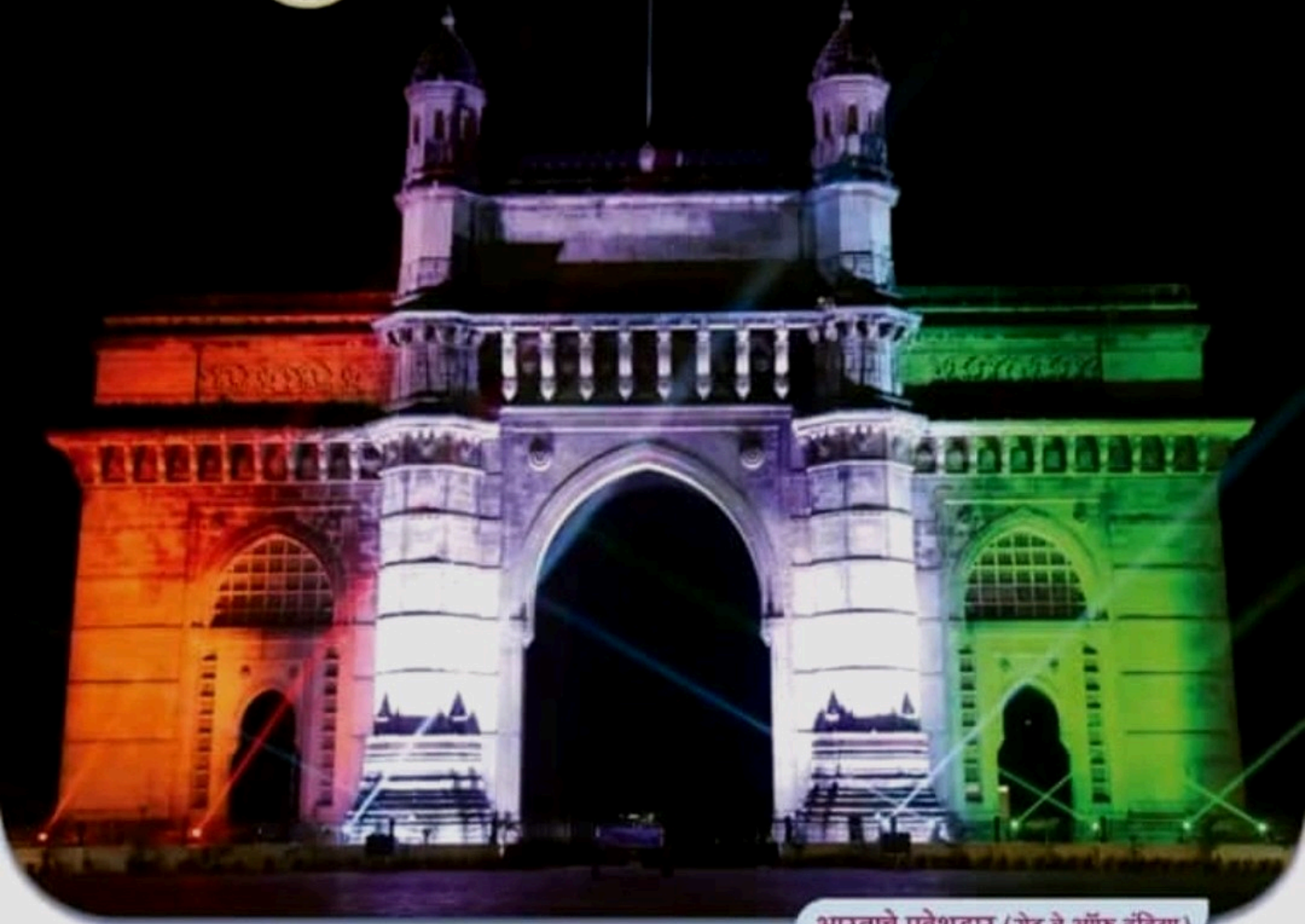
भारताचे प्रवेशद्वार (गेट वे ऑफ इंडिया)