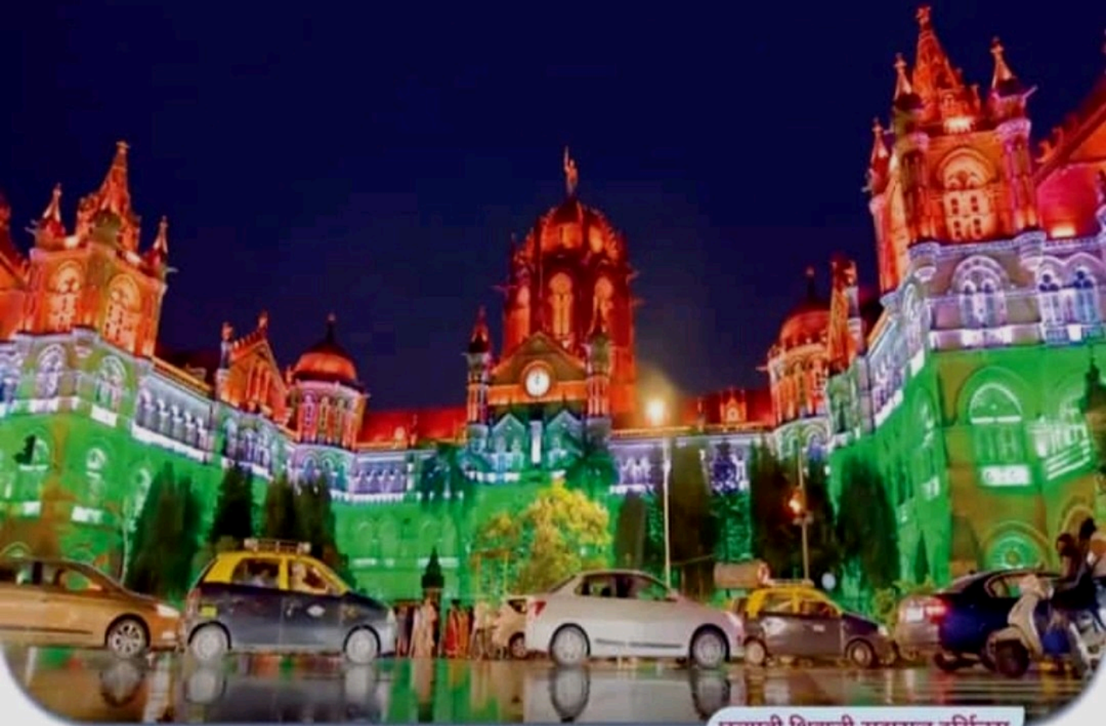
छत्रपती शिवाजी महाराज टर्मिनस